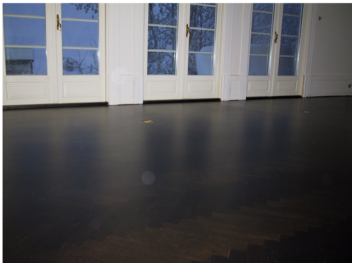
Mørkebeiset eikegulv etterbehandlet med classic Uretan lakk boneglans

Mange ønsker en hvitskurt/lutet patina på sine gulv/vegger, men vil gjerne unngå det svært arbeidskrevende vedlikeholdet og renholdet. For disse anbefaler vi bruk av Classic Coloroil lasur, som gir den ettertraktede patina, men som kombinert med Classic Ure-