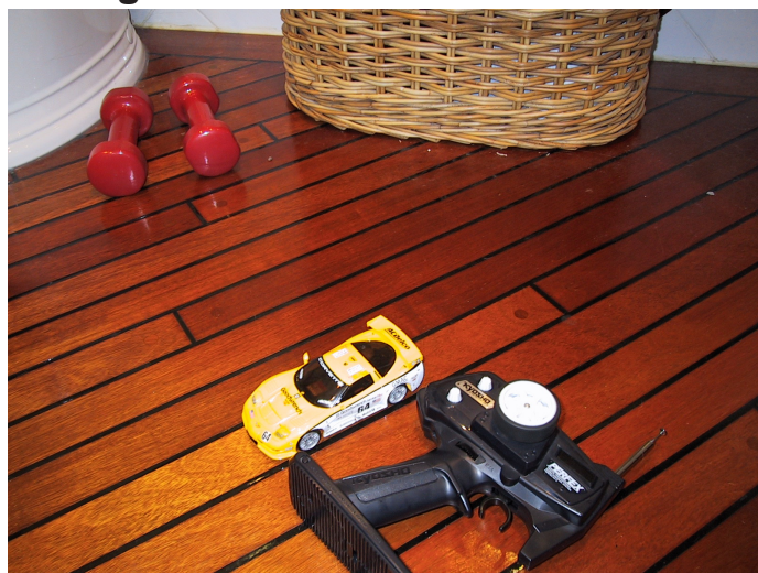
Classic Uretan lakk blank på merbau skipsgulv

Boneglansens unike matthet gir et nær ubehandlet inntrykk med et minimum av lysrefleksjon som gjør at treverkets karakter fremheves. Helhetsinntrykket sammenliknes best med den matte finish ellers kun oppnåelig ved oljebehandling men uten dennes langt mer tungvinne, arbeidskrevende og ikke minst kostbare vedlikehold. Classic Uretan Boneglans foretrekkes også av en rekke malere som ferneris ved marmorering og lasering. Fyldigheten i lakken hinder