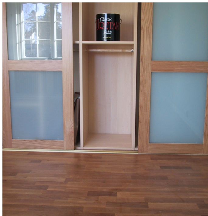
Merbau stavparkett behandlet med Classic Uretan halvblank