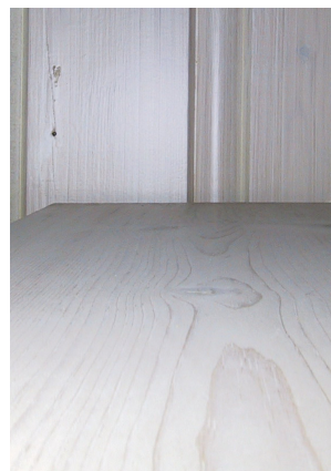
Furupanel behandlet med Classic Coloroil lasur og 2 strøk bobeglans

For den som ønsker en annen innfarging av gulvet enn den originale er Classic Uretan lakk et utmerket valg til overlakking etter beising/lasering/patinerer. Spesielt boneglansens matte finish er svært velegnet for å oppnå et naturlig inntrykk. Enten man ønsker en lysere eller mørkere nyanse, dekkende eller transparent innfarging passer lakken like godt.