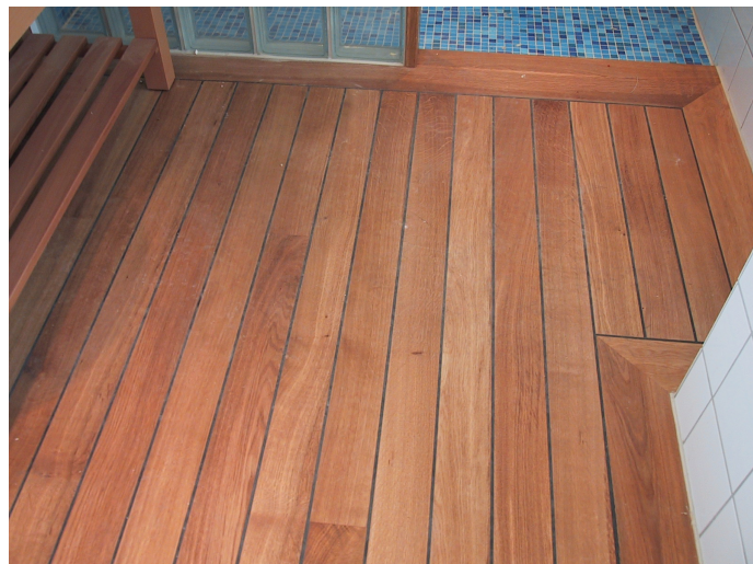
Classic Uretan lakk Boneglans på merbau skipsgulv i dusjrom/badstue

sig, men gir allikevel god utflytning som fagfolk vet å verdsette og som ikke kan sammenliknes med noe annet produkt på markedet. Resultatet blir holdbart, vaskbart og holder i generasjoner.